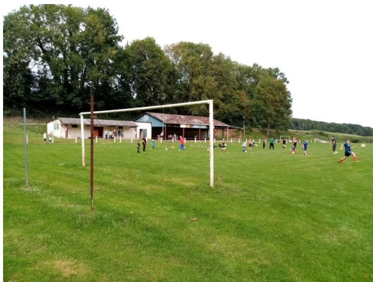
Journée découverte au stade de foot