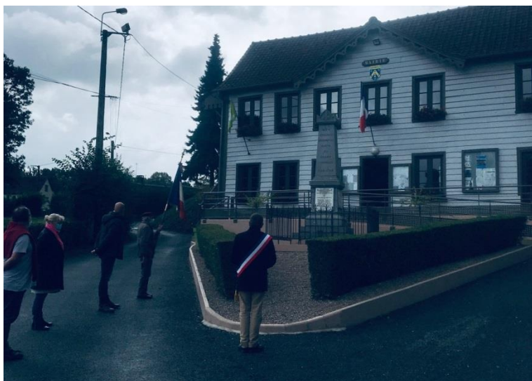
Cérémonie patriotique au monument aux morts